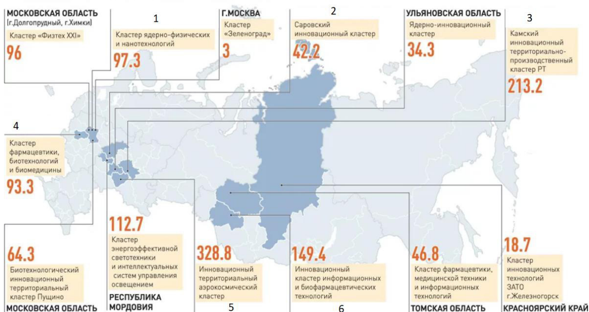
ОБЪЕМ ФЕДЕРАЛЬНЫХ СУБСИДИЙ НА РАЗВИТИЕ ИННОВАЦИОННЫХ ТЕРРИТОРИАЛЬНЫХ КЛАСТЕРОВ, МЛН РУБЛЕЙ

_____ разрабатывает и представляет Государственной Думе федеральный бюджет и обеспечивает его исполнение; представляет Государственной Думе отчет об исполнении федерального бюджета... обеспечивает проведение в Российской Федерации единой финансовой, кредитной и денежной политики; обеспечивает проведение в Российской Федерации единой социально ориентированной государственной политики в области культуры, науки, образования, здравоохранения, социального обеспечения, поддержки, укрепления и защиты семьи, сохранения традиционных семейных ценностей, а также в области охраны окружающей среды.